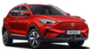
Diamond Red (metallic)