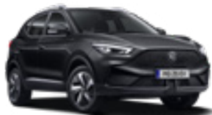
Pebble Black (metallic)