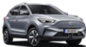
Monument Silver (metallic)