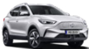
Dover White (non-metallic)