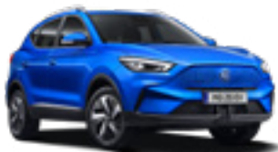
Cosmo Blue (metallic)